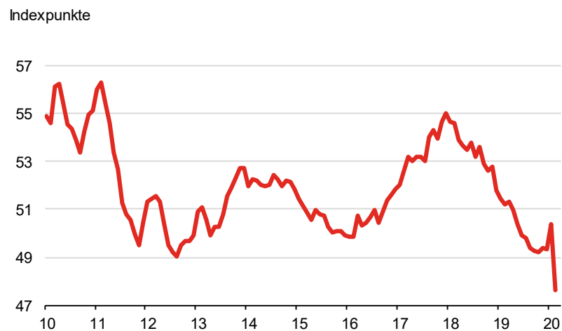
Globaler Einkaufsmanagerindex (verarbeitendes Gewerbe)

Bevölkerungswachstum derzeit gut 1 % beträgt, wäre diese Wachstumshöhe die aktuelle Rezessionsschwelle. Nichtsdestotrotz kann nicht ausgeschlossen werden, dass im März die Einkaufsmanagerindizes außerhalb Chinas ebenfalls spürbar nachgeben und der globale Indikator dann ein Wirtschaftswachstum unterhalb von einem Prozent andeutet.