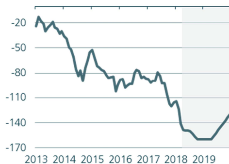
* Bundesanleihen minus Gilts