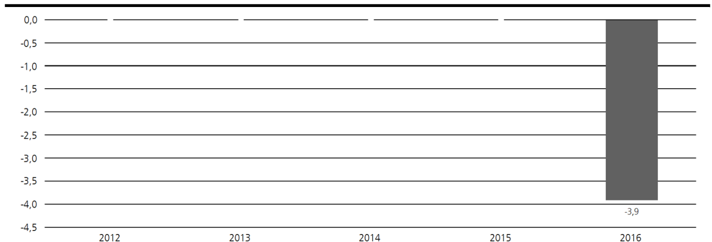
Historische Wertentwicklung Deka-DividendenStrategie Europa (S) (Angabe in %)

Absolute Wertentwicklung vergangener Zeiträume bezogen auf volle Kalenderjahre (Stand 31. Dezember 2016). Quelle: Eigene Berechnungen nach der BVI-Methode, d.h. ohne Berücksichtigung eines eventuell anfallenden Ausgabeaufschlags. Aktuelle Angaben zur Wertentwicklung können den Jahres- und Halbjahresberichten sowie der Homepage der Gesellschaft unter www.deka.de entnommen werden. Die historische Wertentwicklung des Sondervermögens bzw. der einzelnen Anteilklassen ermöglicht keine Prognose für die zukünftige Wertentwicklung.